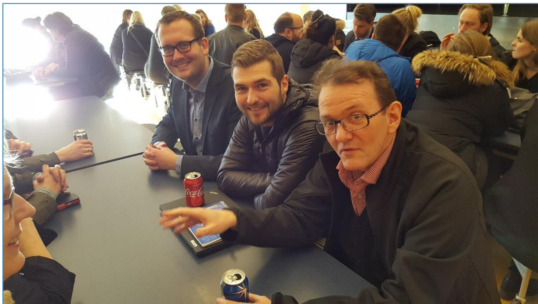
Kennarar á málþingi G4 unglingskólanna vorið 2018

Birting starfsþróunaráætlunar: Starfsþróunaráætlun skólans er hægt að nálgast á vefsíðu hans .