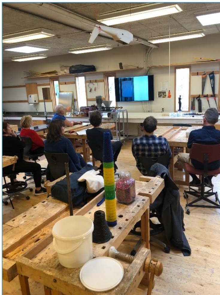
Starfsmenn á vinnustofu í verkefninu „Precious Plastic“ haustið 2018.

Kjarasamningar og fjárveitingar til skólans ráða miklu um umfang starfsþróunar hverju sinni. Samkvæmt kjarasamningum kennara eru ætlaðar 150/126/102 klst. til starfsþróunar og undirbúnings utan starfsramma skólaársins. Heildartalan er breytileg eftir lífaldri og starfshlutfalli. Ef starfsþróun er unnin á starfstíma skóla þá leggst álag á þessa vinnu og tímum sem vinna þarf fækkar sem því nemur. Álag er 33% á verkefni unnin í á virkum dögum en 45% á verkefni unnin um helgar. Kjarasamningar annarra starfsmanna gefa ekki upp ákveðinn tímafjölda til starfsþróunar.